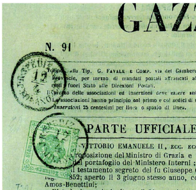
GIORNALE LA "GAZZETTA PIEMONTESE" DELL'11 APRILE 1855 CON SEGNATASSE PER GIORNALI DA 2 KR. VERDE D'AUSTRIA, 1° SOTTOTIPO, ANNULLATO CON IL BOLLO SPEDIZIONIERE "J.R.-SPEDIZ-MILANO". QUESTO SEGNATASSE PER GIORNALI, EMESSO IL 1° MARZO 1853 FU L'UNICO ADOPERATO NEL LOMBRADO VENETO FINO AL 1858.