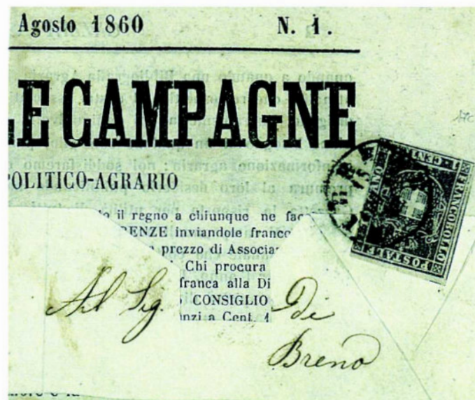
GIORNALE LA "GAZZETTA DELLE CAMPAGNE" EDITO A FIRENZE. RARA COPIA DEL NUMERO UNO, ANNO PRIMO, DEL 10 AGOSTO 1860 AFFRANCATO SOTTO FASCIA CON 1 CENTESIMO VIOLETTA BRUNO DELL'EMISSIONE DEL 1 GENNAIO 1860, ISOLATO IN TARIFFA, ANNULATO FIRENZE 15 AGOSTO 1860, IN GOVERNO DI TOSCANA SOTTO LA LUOGOTENENZA DI EUGENIO DI SAVOIA CARIGNANO (23 MARZO 1860 - 13 FEBBRAIO 1861). IMPRONTA DI ARRIVO A MILANO 16 AGOSTO E BERGAMO DEL 17 AGOSTO 1860.