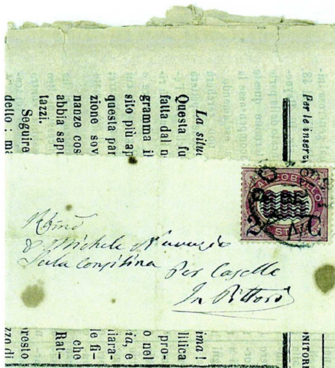
FASCETTA COMPLETA SUL "MONITORE" CON FRANCOBOLLO DI SERVIZIO DEL 1878 SOPRASTAMPATO 2 CENT.MI SU 0,05 DA NAPOLI PER SANZA - CASELLE IN PITTARI (SA). 21 GENNAIO 1879.

adottate misure "poliziesche" di natura fiscale riguardanti i giornali provenienti dall'estero. In attesa dell'emissione delle marche fiscali, la tassa veniva rappresentata da impronte impresse con tamponi "ad umido" nei frontespizi. Venne emessa la marca per giornali da 9 centesimi, (con la disposizione del ministro delle finanze in data 16 marzo 1853), con le iniziali B.G. (bollo gazzette) stampate in nero su carta colorata viola grigio in pasta. Anche nel Ducato di Parma viene usato un bollo a doppio cerchio, "Gazzette estere e cent. 9" prima dell'emissione delle marche per giornali. Il Regno di Sardegna il 1° gennaio 1861 emette dei francobolli per le stampe (decr. 4466 del 26 settembre 1860) con la caratteristica della cifra del valore impressa a secco in rilievo. La Toscana iniziò l'uso delle "marche per giornali" il 1° ottobre 1854 (decr. del 21 agosto 1854) con un semplice bollo a doppio cerchio "Bollo straordinario per le Poste-2 Soldi*" impresso a mano su carta sottile e semitrasparente usato soltanto per pochi mesi.